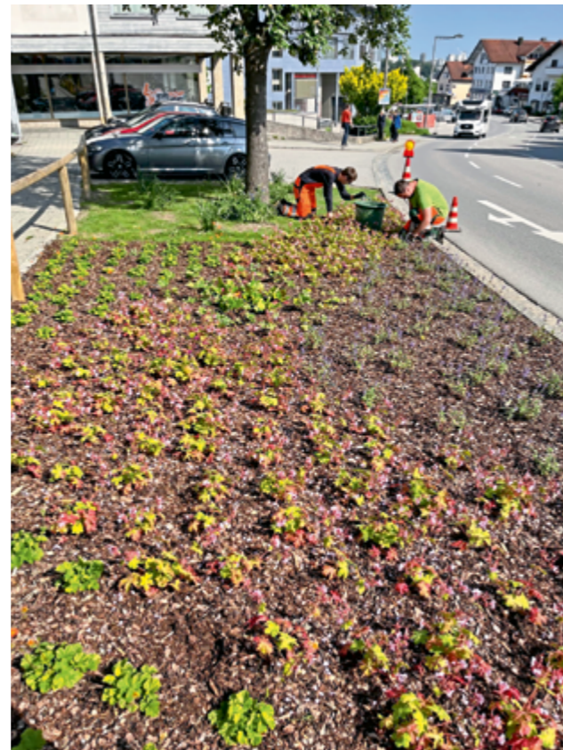
Die Pflege und Unterhaltung der kommunalen Grünflächen ist eine wichtige und zeitintensive Aufgabe des gemeindlichen Bauhofes.

Bei öffentlichen Grünflächen wird ein Fokus insbesondere auf die straßenbegleitenden Flächen gelegt. Vor allem unsere Ortsdurchfahrt durch Burgkirchen führt an einigen grünen Flächen vorbei. Neuerdings empfiehlt es sich die Martin-Ofner-Straße nicht nur schnell mit dem Auto entlang zu huschen, sondern dorthin einen kleinen Ausflug zu Fuß oder mit dem Rad zu machen. Im Kreuzungsbereich Martin-Ofner-Straße/Rupertusstraße wurde das Beet neu bepflanzt. Betrachtet man das Beet ganzheitlich, ist eine wellenförmige Anordnung der Pflanzen zu erkennen – ähnlich wie unsere Alz, die das Ortsbild der Gemeinde Burgkirchen wesentlich prägt. Die Welle führt zudem an 4 Pflanzen vorbei, die in Anlehnung an die vier Jahreszeiten zu unterschiedlichen Zeitpunkten blühen.