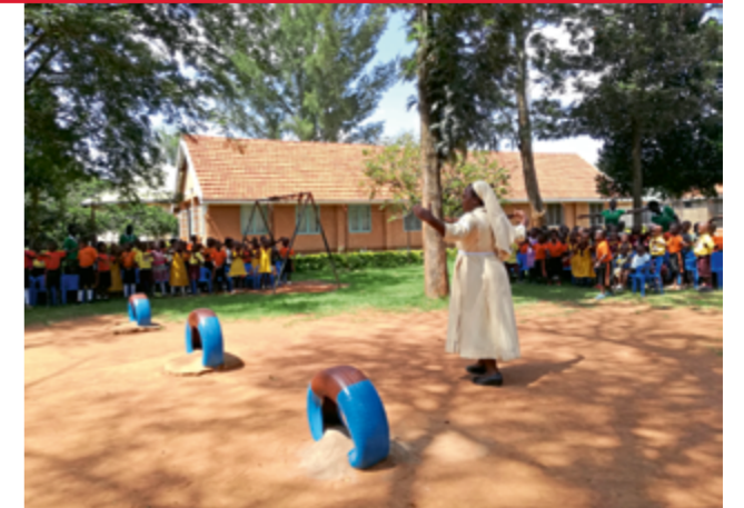
Die Schulleiterin und Projektverantwortliche Schwester Harriet und die Schülerschaft der Mother Kevin Junior School bejubeln den so wichtigen neuen Schulkomplex

Die direkt Begünstigten durch das Projekt sind aktuell 1.026 Schülerinnen und Schüler. Insbesondere die insgesamt 574 SchülerInnen (davon 294 Mädchen und 280 Jungen) der Grundschule von den Klassen 1 bis 7 profitieren von den neuen Klassenräumen. Aber auch die 20 Kleinkinder im Alter von 2-3 Jahren aus der Tagesbetreuung sowie die 432 Kinder aus dem Kindergarten im Alter von 3-5 Jahren genießen die geschaffenen Kapazitäten. Die Schwestern können den Kindern nun eine moderne Einrichtung zur Verfügung stellen, die ein effektives Lehren und Lernen unterstützt und die es möglich macht, moderne Lehrmethoden auszuüben, um ein interaktives Lernen zu fördern.