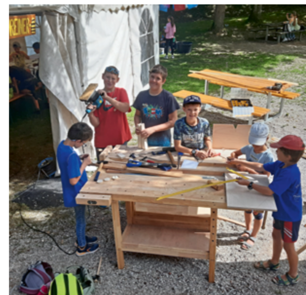
Wo gehobelt wird, fallen Späne - in der Schreinerei