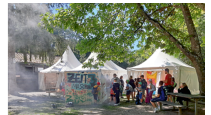
Kam am Freitag auch untern Hammer – die coole Zeitmaschine