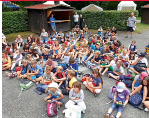
Aufmerksames Zuhören bei der Gewerbeschau

Am ersten Tag richteten die Kinder ihre Ministadt selbst ein, gestalteten die Werkstätten mit und eröffneten diese. Täglich zwischen 9:00 Uhr bis 16:00 Uhr hatten die Kinder die Möglichkeit, ihre Ideen in das Spielstadtleben einzubringen und den Tag aktiv mitzugestalten. Angefangen beim Arbeitsamt reichte die Palette über Einwohnermeldeamt, Bank, Post, Beautyfarm, Zeitungsagentur und noch mehr. Für jeden Tag wurde ein Bürgermeister gewählt, alles natürlich ganz demokratisch. In der Schreinerei, Schneiderei und Dekowerkstatt konnte jeder „Mini-Burgkirchner“ einen oder bis zu fünf Tage in der Spielstadt arbeiten. In der Kreativwerkstatt wurden Kreativität und neue Ideen unterstützt. Der Freizeitclub bot viele Möglichkeiten zur Freizeitgestaltung. Jeder konnte „Mini-Bukis“, das Geld der Spielstadt, verdienen und ausgeben. Die Kids konnten nachempfinden, wie die Welt der Erwachsenen funktioniert. Ein Spaß und Abenteuer, das sich täglich fast 130 Kinder nicht entgehen ließen. Für neugierige Erwachsene gab es einen sog. „Elterngarten“, in dem sich Besucher, unter der Betreuung der Kinder, ein Bild von der Spielstadt Mini-Burgkirchen machen konnten.