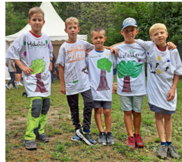
Von der Dekowerkstatt bemalte Fußball Trikots