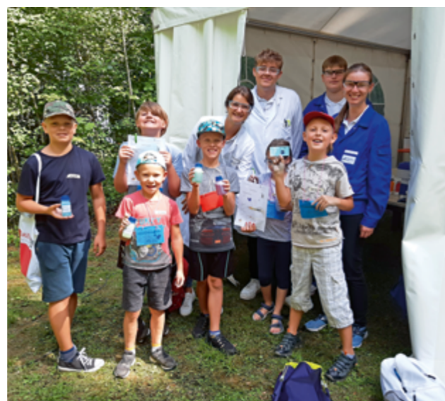
Im Chemielabor wird Duschgel selbst hergestellt