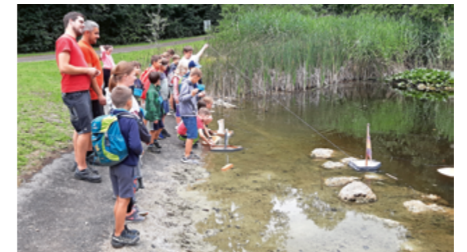
Regatta der eigens gebauten Holzboote