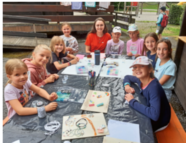
Fleißige Schmuckbastlerinnen in der Kreativwerkstatt