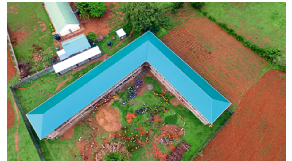
Aus der Drohnen-Perspektive ist das von Burgkirchen finanzierte L-förmige Dach der neuen Schule gut zu sehen. Für europäische Maßstäbe hat es eine außergewöhnliche Farbe. Das Türkis ist ein guter Kontrast zur rotbraunen afrikanischen Erde.