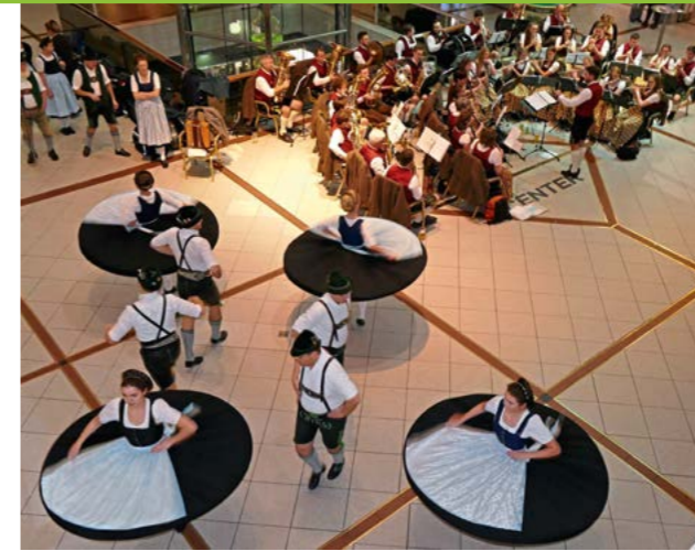
Auftritt im Europacenter