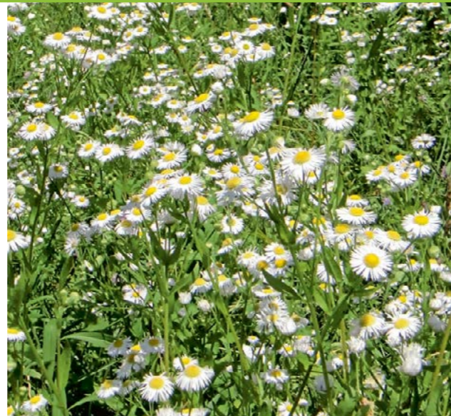
Auch die Kleingartenanlage bleibt nicht verschont!

Das einjährige Berufkraut ist ein außerordentlich erfolgreicher invasiver Neophyt. Es besiedelt mit enorm hohen Samenmengen jede Lücke und verdrängt angestammte Pflanzen – auch seltene! Es stellt eine nicht zu unterschätzende Gefahr für die heimische Flora dar. Um die biologische Qualität von extensiven genutzten Flächen zu erhalten muss es bekämpft werden. Eine Prävention erreicht man durch sofortiges Ausreißen neuer Vorkommen, oder auch durch die korrekte Entsorgung des Pflanzenmaterials (verschlossener Müllsack über Kompostieranlage). Allein durch den Wind werden die enorm produzierten leichten Samen verfrachtet. Mit Vorliebe besiedelt es Straßen- und Wegränder, Bahnböschungen, Kiesgruben sowie extensiv genutzte Weiden und Wiesen ebenso wertvolle Naturschutzwiesen. Das einjährige Berufkraut wird leicht mit Margeriten verwechselt.