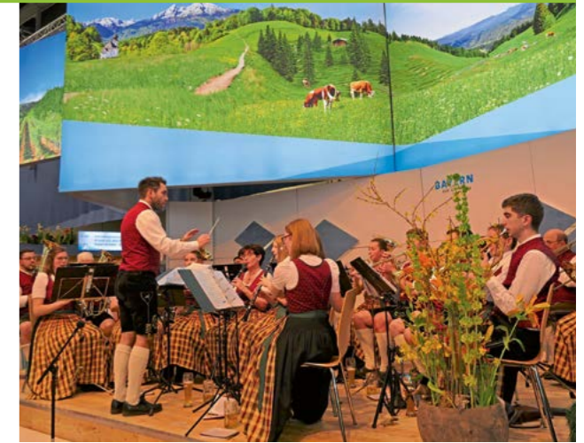
Piusbläser in Bayernhalle