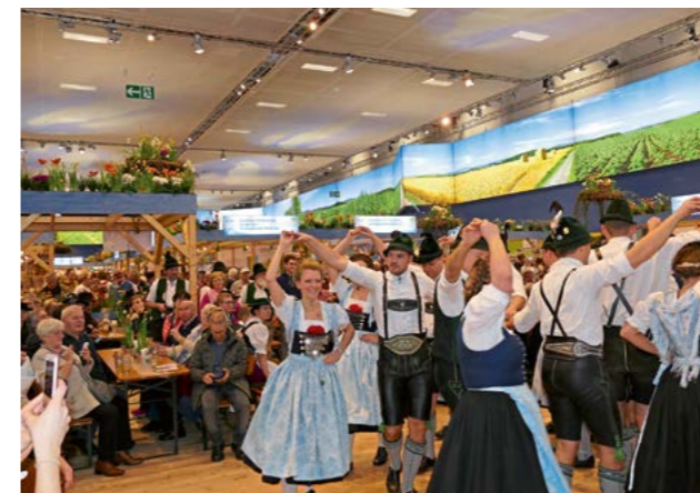
Messeauftritt Trachtler mit Blick in die Menge