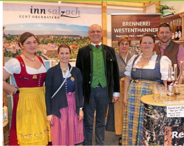
Am Stand Tourismus Inn-Salzach mit den Ausstellern Westenthanner und Obermeier Frischeier

land. Es gab noch ein Highlight auf der Messe. Erstmals hatte der Tourismusverband Inn-Salzach einen Stand in der Bayernhalle. Für den Landkreis Mühldorf war „Obermeier Frischeier“ vertreten und für den Landkreis Altötting die Burgkirchner Brennerei Westenthanner. Erwähnt sei noch, dass Sponsoren mit reichlich Proviant die 60 Leute im Bus versorgten. Es waren die Metzgerei Hölzlwimmer, Bäckerei Schönstetter, Bräu im Moos und Erdbeeren Hausner. Die Buskosten zahlte die Gemeinde, das Hotel ein jeder selbst. Burgkirchen in Berlin – über dieses Abenteuer könnte man viele Seiten schreiben oder mit zwei Worten zusammenfassen: Schee wars.