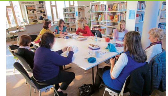
Die Gemeindebibliothek Burgkirchen will zukünftig vermehrt Gruppenarbeiten wie den „Handarbeits-Treff“ (14tägig an einem Donnerstagnachmittag) Raum bieten

gkirchner Bücherei ganz im Zeichen des Rock’n’Roll stand: dabei heizte die Band „Jimi Duke & The Posers“ den vielen Gästen im Lesecafé mächtig ein.