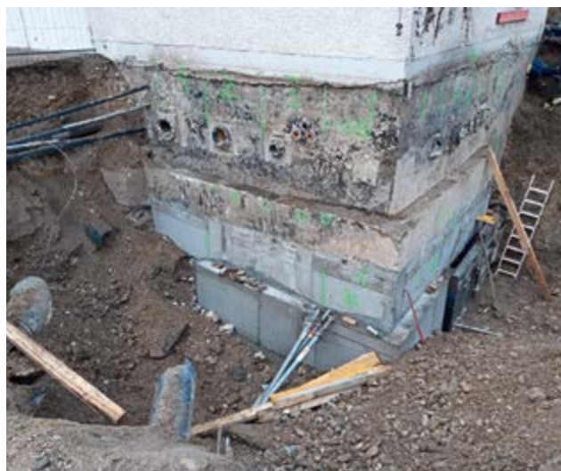
Die Unterfangung des Bestandsgebäudes war ein komplexes Vorhaben