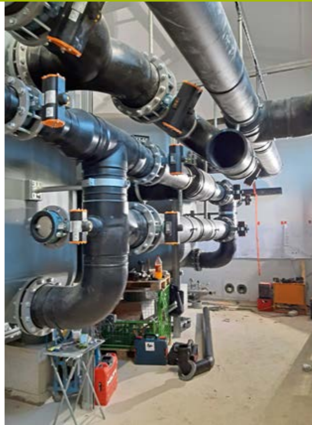
Beeindruckende Dimensionen der neuen Verrohrung

Auch innerhalb des alten Technikgebäudes hat sich seit dem Einbringen der Filterbehälter viel getan. Die Rohrleitungen sind zu einem großen Teil fertig und werden dann über einen Durchbruch in den Anbau weitergeführt, der die Pumpentechnik beherbergen wird. Das Edelstahlbecken ist umlaufend fertig, sobald die Temperaturen es zulassen wird der Boden eingebracht.