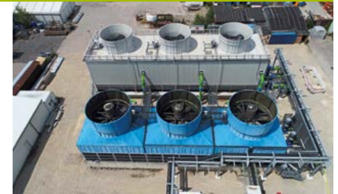
InfraServ Gendorf investiert kontinuierlich hohe Summen in Energieeffizienz-Projekte wie etwa die Modernisierung der Rückkühlwerke im Chemiepark.