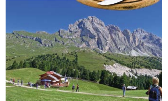
Fam. Mughal, Mühldorf