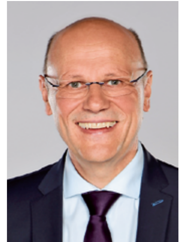
Johann Krichenbauer Erster Bürgermeister