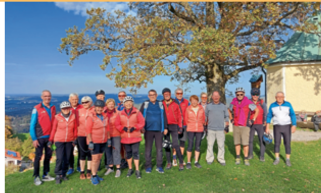
Drei-Täler-Runde am Samerberg mit Blick zu Chiemsee

Die Radspportwoche gehört mittlerweile zum festen Bestand der Dienstagsradler des SVGB. Heuer war es bereits die neunte Veranstaltung, die im Juli diesmal in die Wachau führte. Von einem Quartier mitten in Krems ergaben sich vielseitige Möglichkeiten, das Weinviertel, das Mostviertel und das Waldviertel zu erkunden. Eine gelungene und abwechslungsreiche Woche, die bei den zwanzig Teilnehmern gut in Erinnerung bleibt. Die Radtouren in die schöne und sehr abwechslungsreiche Umge-