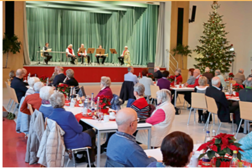
Plätzchen, Punsch und Blasmusik: Auch in diesem Jahr fand die gemeinsame Adventsfeier der Pensionäre und Ehemaligen des Werkes GENDORF großen Anklang

Rund 100 frühere Mitarbeiterinnen und Mitarbeiter besuchten die Adventsfeier der Vereinigung der Pensionäre im Industriepark (VPI) und der Vereinigung der Ehemaligen im Chemiepark GENDORF. Begleitet wurde die Veranstaltung von einem besinnlichen vorweihnachtlichen Rahmenprogramm. Auch in diesem Jahr folgten zahlreiche ehemalige Mitarbeiterinnen und Mitarbeiter der Einladung zur gemeinsamen Adventsfeier im Betriebsrestaurant des Chemieparks