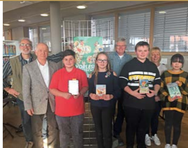
Ein Beispiel für die erfolgreiche Zusammenarbeit von Schule-Bücherei ist die Ausrichtung des jährlich in der Gemeindebibliothek stattfindenden Lesewettbewerbs der 6. Klassen (Abschlussfoto der Veranstaltung von 2019 mit den Klassensiegern und der gemeinsam von Bibliothek und Mittelschule gestellten Wettbewerbsjury)