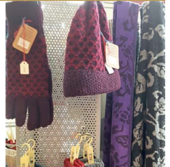
Strickwaren aus Alpaka

Der Weltladen ist auf dem Wochenmarkt! Fair gehandelte Waren werden am 27. November von 7.30 Uhr bis 12.00 Uhr auf dem Wochenmarkt angeboten