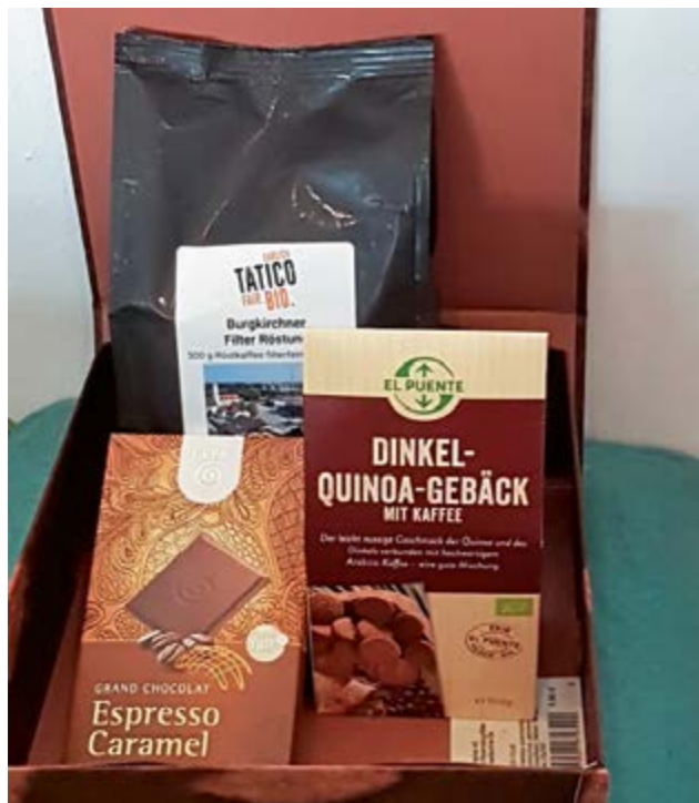
Burgkirchner Kaffee und natürliche Schokolade

Schauen Sie im Weltladen in der Rupertusstraße 2 vorbei und lassen Sie sich inspirieren. Wie schon in früheren Jahren können Sie bei einem Einkauf über 10 € an unserer Adventverlosung teilnehmen.