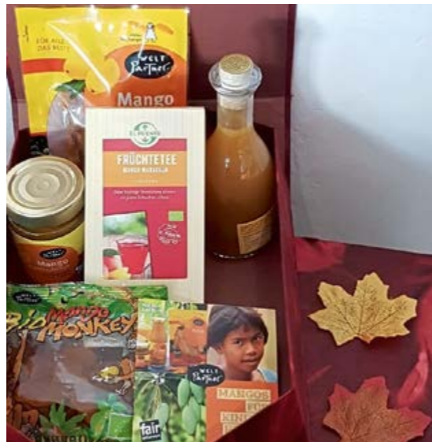
Leckeres aus Mangos