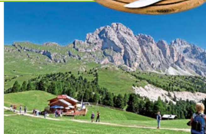
Fam. Mughal, Mühldorf