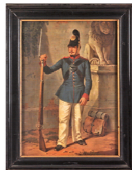
Bayerischer Infanterist 1860