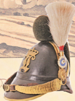
Raupenhelm für Chevaulegers