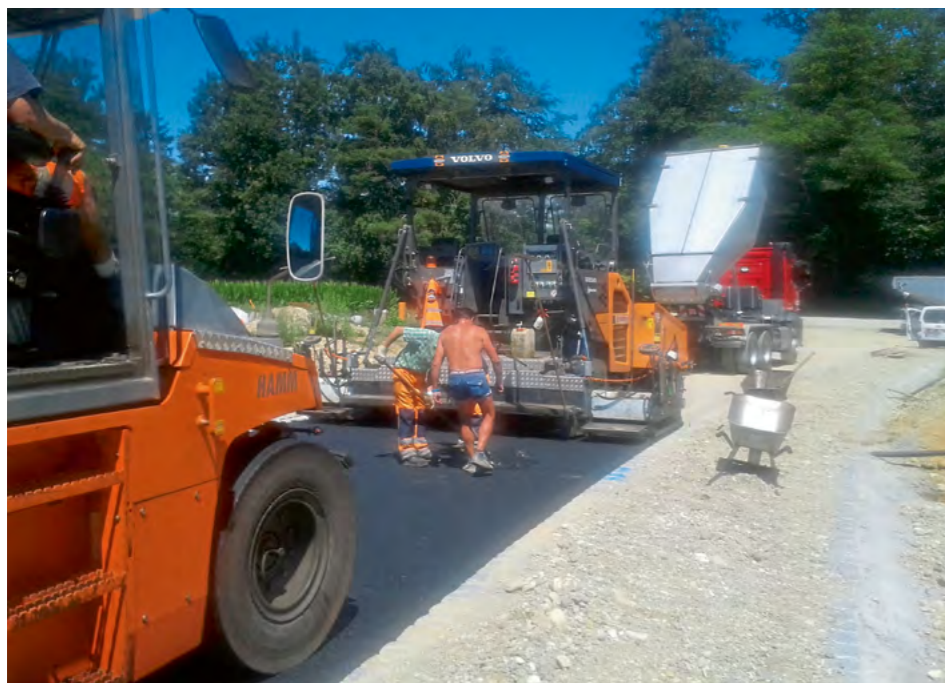
Die Asphaltfirma baut die erste Asphalterschicht in die Sudetenstraße ein.

Anfang Juli wurden die sieben Straßen im neuen Baugebiet „Wimpasing II“ asphaltiert und die Straßen von der Verwaltung als Ortsstraße gewidmet. Somit sind alle Straßen im Baugebiet für den Verkehr freigegeben. Gleich nach der Freigabe wurde die erste Baustelle im Baugebiet begonnen. In bereits 4 Jahren wird das Baugebiet voraussichtlich komplett bebaut sein.