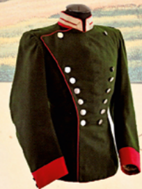
Waffenrock für Chevaulegers