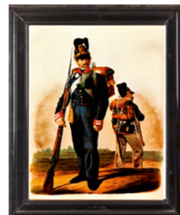
Linien Infanterie Leib- Regiment