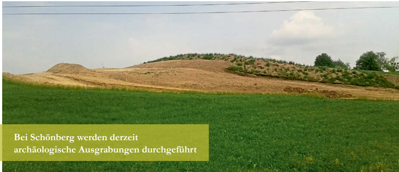
Bei Schönberg werden derzeit archäologische Ausgrabungen durchgeführt

So ist in Schönberg seit dem Jahr 1051 ein Königsgut mit dem Namen „Nahtstal“ mit königlichen Ministerialen urkundlich nachweisbar. Die Kirche St. Peter und Paul, die von den dortigen Adeligen errichtet wurde, fiel bereits im Jahr 1807 der Säkularisation zum Opfer. Ob die Archäologen, die seit einigen Monaten bei Schönberg Ausgrabungsarbeiten durchführen, nun Funde aus dieser Zeit ans Tageslicht bringen, wird sich zeigen.