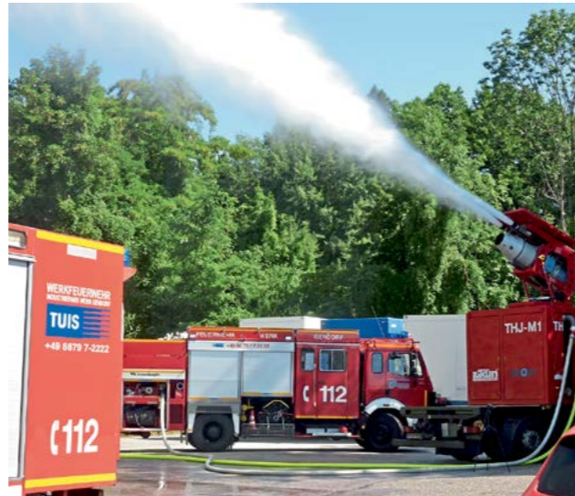
Klein aber oho - Das neue Turbolöschsystem der Werkfeuerwehr setzt bei der Brandbekämpfung auf Wassernebel.

Das Turbo Hydrojet Modul ist dabei speziell für Außeneinsätze im Chemiepark GENDORF zugeschnitten. Das äußerlich unspektakuläre mobile Modul misst gerade mal ein Meter fünfzig auf zwei Meter fünfzig, hat es aber in sich: Es besteht aus einer Flugzeugturbine, die ein brennendes Objekt in bis zu 150 Meter Entfernung in eine Wasserwolke einhüllen kann. „Im Gegensatz zu herkömmlichen Wasserwerfern können die Feuerwehrmänner dadurch aus größerer Entfernung agieren, was ihre Sicherheit erhöht“, betont Siebert.