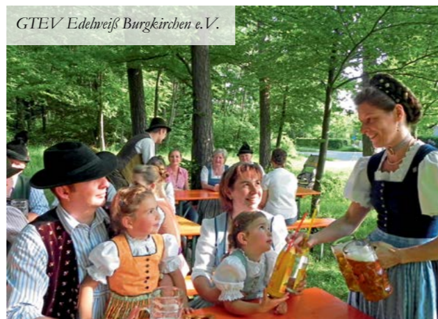
GTEV Edelweiß Burgkirchen e.V.

Der Trachtenverein Edelweiß Burgkirchen lädt am Sonntag, 2. Juli, zu seinem urgemütlichen Waldfest nach Holzen ein. Ab 11 Uhr werden die Besucher mit Steckerlfisch, Grillspezialitäten, Brotzeiten oder Kaffee und Kuchen bewirtet. Für beste Biergartenstimmung sorgt ab Mittag die Piracher Blasmusik und ab dem späten Nachmittag die Musikantengruppe „D’Veranstaltung“. Dazu gibt es wieder sehenswerte Einlagen der Plattler und Schnoizer sowie der Kindergruppe des Trachtenvereins. Die kleinen Besucher können sich auf verschiedene Attraktionen wie Hüpfburg freuen.