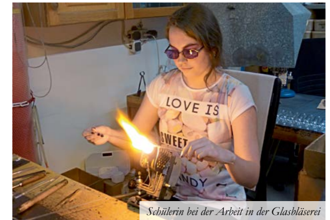
Schülerin bei der Arbeit in der Glasbläserei

Am Mittwoch betonierten zwei Schüler gemeinsam mit der Baufirma Pfungstl das Fundament an der Kapelle am Eschelberg. Drei Schülerinnen waren in der Glasbläserei Stollwerk um die Glasstrahlen als künstlerisches Gestaltungselement zu erstellen.