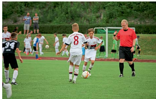
Szene aus dem D-Jugend-Spiel FC Bayern München – FSV Waiblingen.