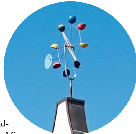
Kindergarten Paul Gerhardt

An diesem Tag bekommen Sie einen kleinen Einblick in unser Haus und lernen das pädagogische Fachpersonal kennen. Auch zur pädagogischen Ausrichtung, dem Mittagessen, den flexiblen Buchungszeiten und zu unseren Workshops werden wir Ihre Fragen gerne beantworten. Sie können nach der kurzen Besichtigung der Räumlichkeiten mit Ihrem Kind bei Kaffee und Kuchen in unserem Kindergarten verweilen und den Samstagvormittag bei uns ausklingen lassen. Sollten Sie an diesem Tag verhindert sein, so können wir gerne telefonisch einen Termin für die Anmeldewoche vom 29.01.2018 bis 02.02.2018 vereinbaren.