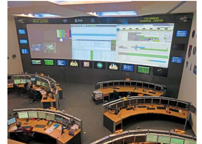
Deutsches Zentrum für Luft- und Raumfahrt in Oberpfaffenhofen