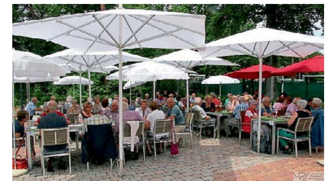
Gartenfest des VPI

Die Veranstaltungen finden im kleinen Speisesaal des Sozialgebäudes oder im Gästehaus des Chemieparkes statt. Die Termine werden auch in der ANA unter „Alles auf einen Blick“ Burgkirchen bekannt gegeben.