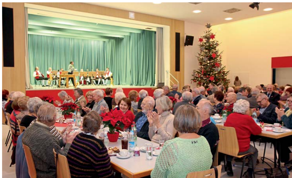
Die Pensionäre und Ehemaligen des Werkes GENDORF zeigen nach wie vor eine große Verbundenheit zum Chemiepark GENDORF: Die gemeinsame Adventsfeier fand auch dieses Jahr großen Anklang.

Zum diesjährigen Rahmenprogramm zählten unter anderem ein Auftritt der Kinder des Kindergartens St. Hedwig sowie eine weihnachtliche Lesung durch Pfarrer Michael Brunn. Vorweihnachtliche Musikstücke des Symphonischen Blasorchesters Werk Gendorf e.V. rundeten den adventlichen Nachmittag ab.