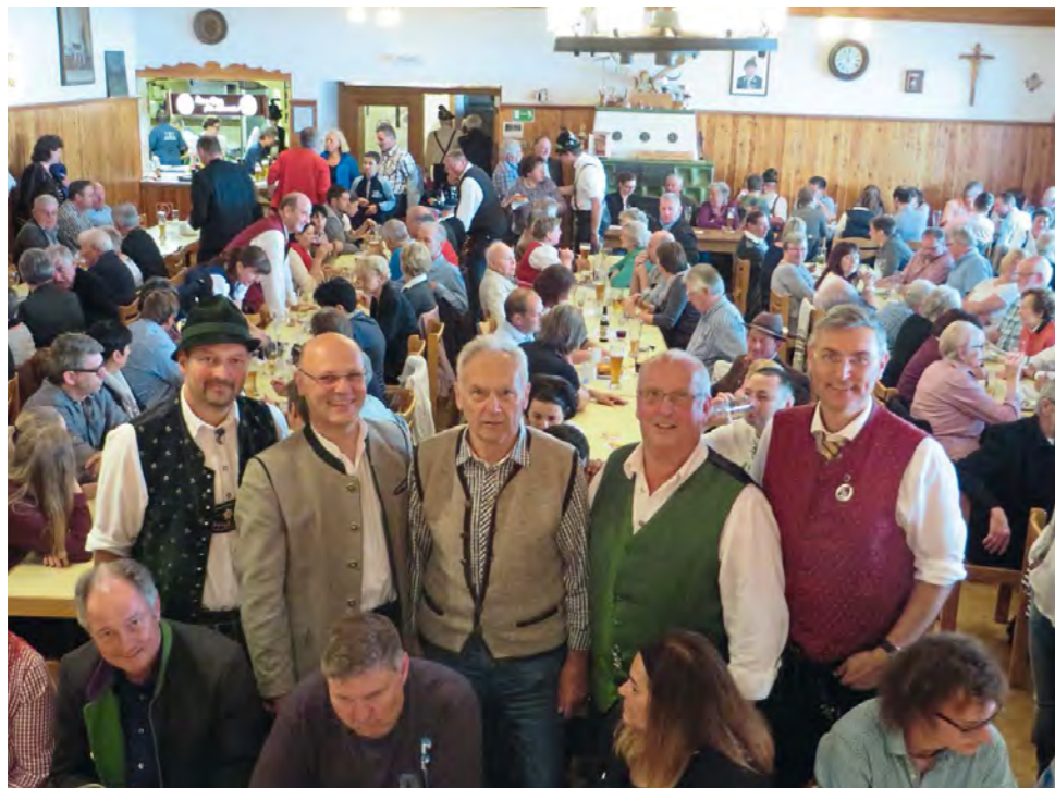
Organisatoren und Spender im voll besetzten Trachtenheim

Um einen möglichst ansehnlichen Betrag zu erzielen, konnten sich die Veranstalter über Spenden und Vergünstigungen der Lieferanten freuen. So wurden neben den vielen Kuchen und Torten der vielen fleißigen Bäckerinnen, die Weißwürste von der Metzgerei Hölzlwimmer sowie Brezen und Semmeln von der Bäckerei Schönstetter gespendet. Der Bräu im Moos als Haus und Hoflieferant der Getränke im Trachtenheim stellte ebenfalls einen Teil der Getränke kostenlos zur Verfügung.