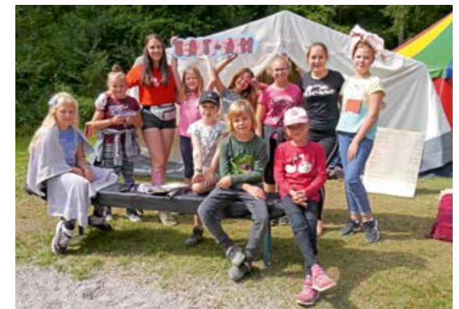
"Hurra – auch die Beauty Farm ist wieder in Mini-Burgkirchen dabei"

Das Team Mini-Burgkirchen würde sich über einige Spenden sehr freuen. Benötigt werden Kuchen für den Elterngarten, Blumen für die Gärtnerei und Obst- u. Gemüsespenden.