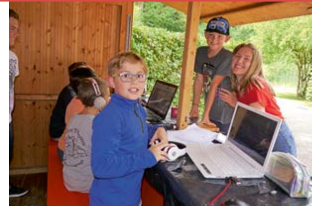
Täglich auf Sendung – Kinderradio Mini-Bu

Für Besucher gibt es endlich wieder den Elterngarten, wo man sich von Kindern bewirten und mit Kaffee, Kuchen, kalten Getränken, Semmeln verwöhnen lassen kann. Zusätzlich gibt es wieder den beliebten Job als Stadtführer Kind. Natürlich sind auch die Erwachsenen neugierig, was denn in einer Kinderstadt so abgeht. Gerne dürfen sie die Spielstadt erkunden, aber nur unter Betreuung und Begleitung eines ausgebildeten Stadtführerkindes.