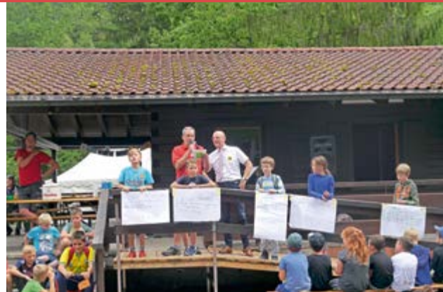
„Mit Spannung erwartet – welcher Kandidat wird Bürgermeister von Mini-Bu?“

30 Jugendliche bzw. junge Erwachsene sind heuer im Betreuersteam und engagieren sich sechs Tage