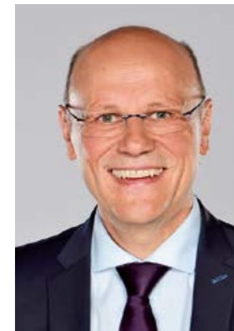
Johann Krichenbauer Erster Bürgermeister