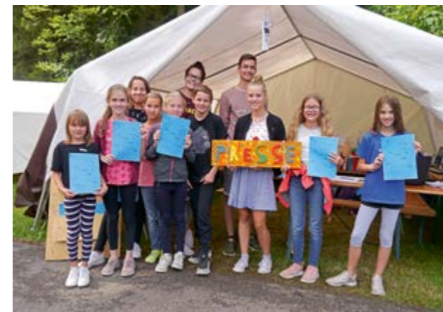
„Rasende Kinderreporter bringen täglich eine Spielstadtzeitung heraus“