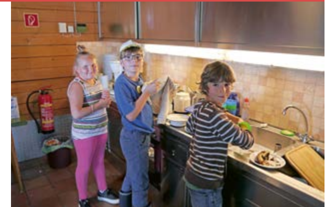
„Fleissiger Gastronomie Nachwuchs im Elterngarten“