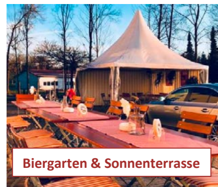
Biergarten & Sonnenterrasse