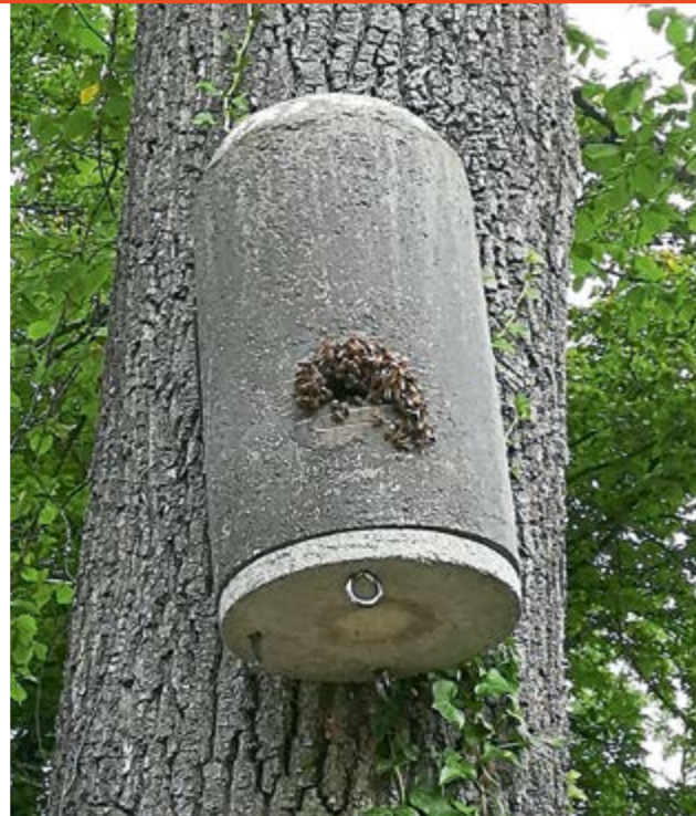
Wilde Bienen am Fledermauskasten im Juni

Obwohl die wilden Bienen in den zwei Fledermauskästen am Max-von-Mayer-Weg an der Alz in Gendorf im März/April verschwunden waren, konnten ab Mai plötzlich wieder zwei Völker gesichtet werden, die vermutlich von neuen Schwärmen stammten. Den ganzen Sommer und Herbst waren die zwei Bienenvölker fleißig an den Fledermauskästen zu sehen. Es ist zu hoffen, dass sie den Winter in den geräumigen Fledermausbrutkästen überleben und im Frühjahr die Fußgänger an der Alz wieder erfreuen.