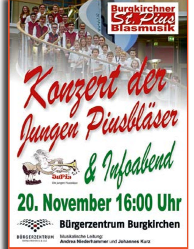
Gruppenbild der Jungen Piusbläser

Am Samstag den 20. November um 16:00 Uhr spielen die Jungen Piusbläser im großen Saal im Bürgerzentrum Burgkirchen ein kleines Konzert das zeigt, dass Blasmusik nicht nur traditionell sein muss! Nach dem kleinen Konzert stellen sich JuPis sowie Vertreter der Musikschule kurz vor und geben Informationen, wie man Instrumente lernen und Teil der Burgkirchner Blasmusik werden kann. Es sind ausdrücklich nicht nur „junge“, sondern auch „jung gebliebene“ Musikinteressierte eingeladen!