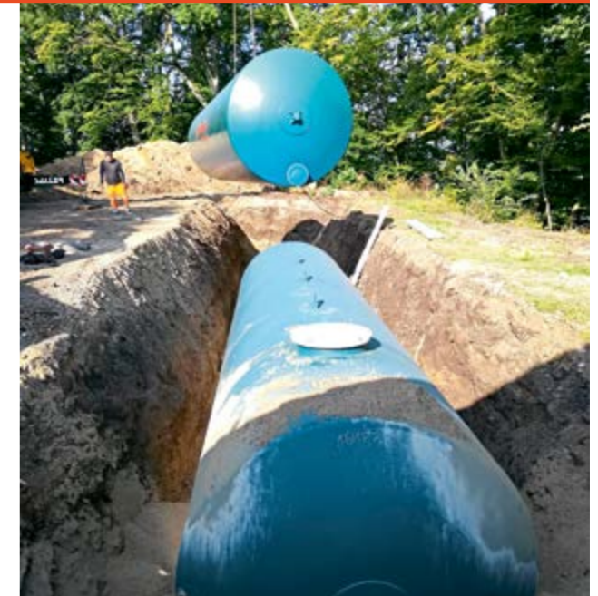
Einbau der 2 Stahltanks mit je 50 cbm Wasser

Da bisher nur ein Unterflurhydrant für einen Lösch-einsatz auf dem Margarethenberg für die Feuerwehr im Brandfall zur Verfügung stand, errichtete nun die Gemeinde Burgkirchen a.d.Alz einen Löschwasserbehälter mit 100 cbm (2 Stahltanks mit je 50 cbm), der im Boden versenkt wurde. Nun ist sichergestellt, dass genug Löschwasser für die Feuerwehr vorhanden ist, für den Fall, dass es in der Kirche, dem Pfarrheim oder in den zwei Anwesen brennen sollte.