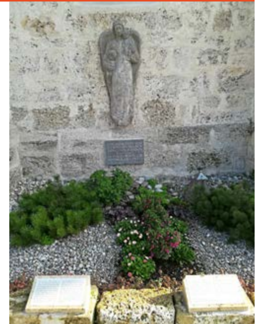
Kindergrab St. Johann

Die Ortsgruppe „Kindergrab Burgkirchen“ des Vereins „Für das Erinnern“ aus Mühldorf, lädt die Bevölkerung ganz herzlich zum Gedenken am Kindergrab bei der Kirche St. Johann in Burgkirchen ein. Die Veranstaltung findet am Samstag 13. November 2021 von 16.00 - ca. 16.45 Uhr statt. Hierbei wird den 160 Kindern gedacht, die 1944/45 in der Ausländerkinder-Pflegestätte Burgkirchen (Nähe Keltenhalde) geboren wurden und anschließend grausam infolge fehlender oder falscher Ernährung und mangelhafter Pflege dort nach kurzer Zeit verstarben. Gedenkworte werden auch vom ukrainischen und polnischen Konsul gesprochen.