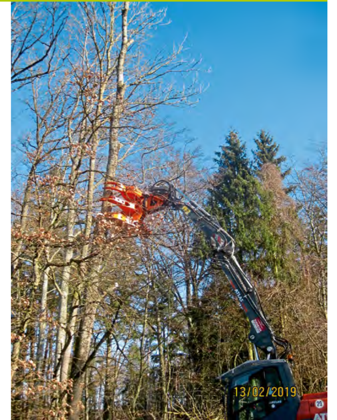
Eine Spezialmaschine entfernt einen toten Baum am Straßenrand

Da die Gemeinde Burgkirchen a.d.Alz die Verkehrssicherungspflicht an öffentlichen Wegen, Straßen und Plätzen sehr ernst nimmt, werden jährlich die Bäume im Straßenbegleitgrün von ausgebildeten Baumkontrolleuren auf ihre Sicherheit überprüft. Werden geschädigte und gefährliche Bäume festgestellt, müssen sie zum Schutz der Verkehrsteilnehmer unverzüglich entfernt, bzw. zurückgeschnitten werden. Da das Eschentriebsterben, das durch Pilze ausgelöst wird, auch in Burgkirchen a.d.Alz stark die Eschen schädigt und zum Absterben bringt, mussten geschädigte und gefährliche Eschen entfernt werden. Eine Bekämpfung der Baumkrankheit ist nicht möglich. Da der letzte Sommer besonders heiß und lang war, wurden auch andere Baumarten zum Teil sehr geschädigt. So mussten auch geschädigte Eichen und Buchen entfernt oder das Totholz aus ihren Kronen entfernt werden. Da die Gemeinde nicht über die notwendigen Spezialmaschinen verfügt, wurden die Maßnahmen an externe Fachfirmen vergeben. Sicherungsarbeiten waren insbesondere am Kustererberg und am Reibwirtsberg notwendig. Die Verkehrssicherungspflicht gilt übrigens auch für private Grundstücksbesitzer, wenn Bäume an öffentlich gewidmeten Wegen und Straßen stehen.