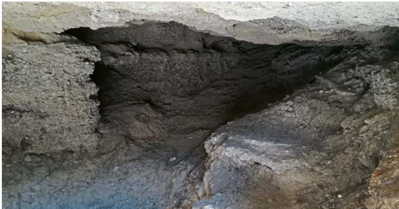
In der geräumigen Hexenhöhle